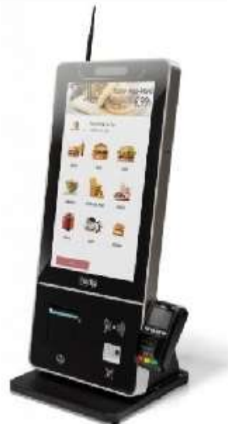
T-Quiosk-1 21.5" Counter versie.